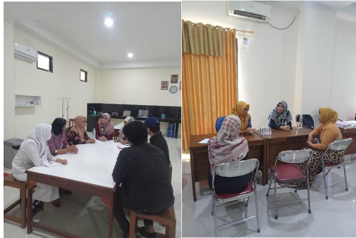
b. Puncak Acara Peringatan Hari Anti Kekerasan di Universitas Sarjana Wiyata Tamansiswa