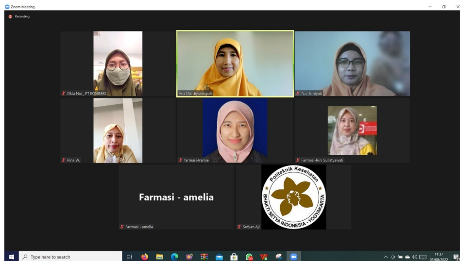
Jadwal Evaluasi Kurikulum