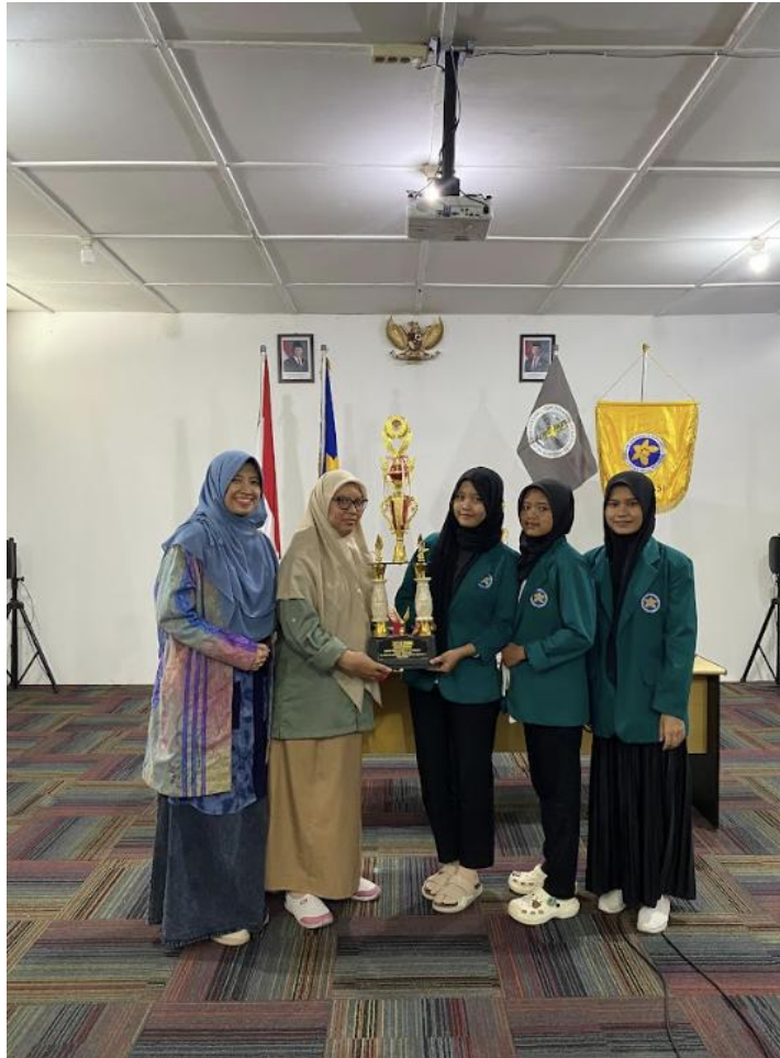
Penyerahan Piala Juara 1 LCCF