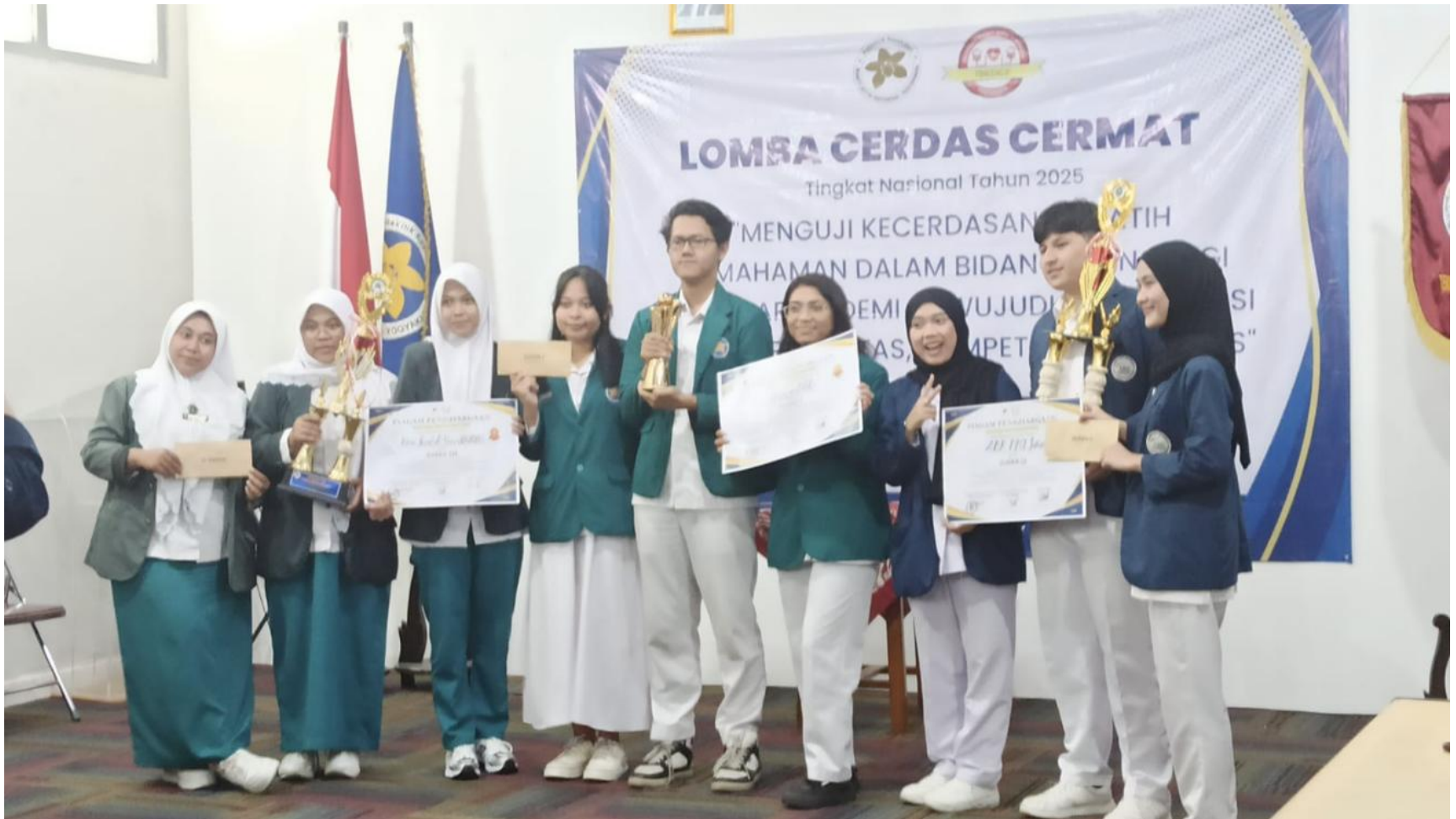
Penyerahan Piala kejuaraan LCC TBD