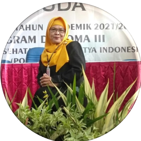
Pranata Kerjasama & Kehumasan