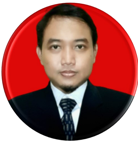
Kepala Bagian Kerjasama